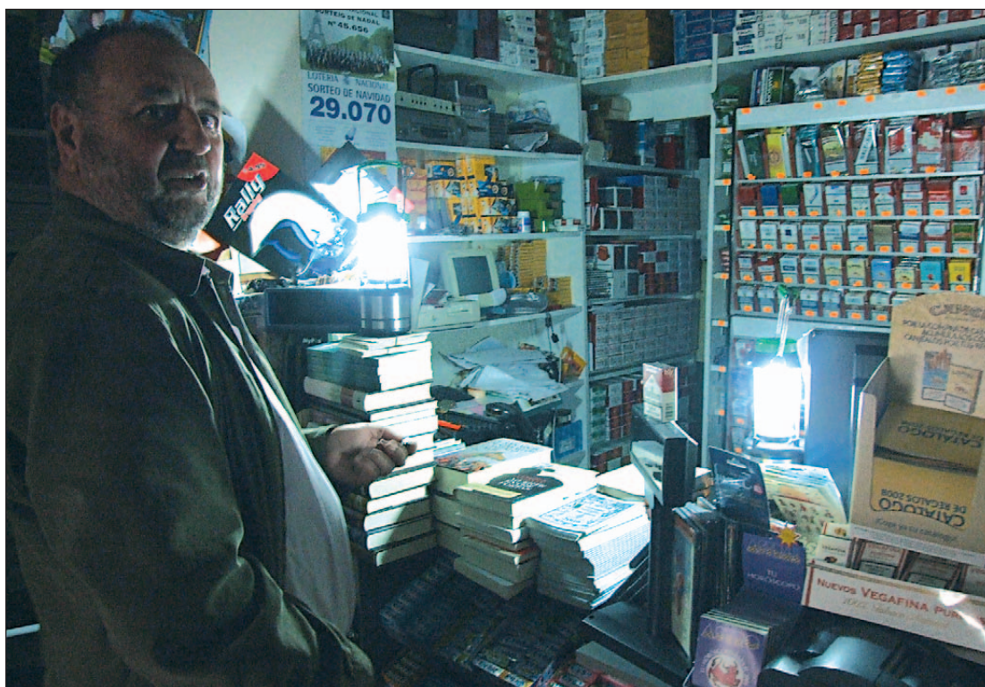
El comerç de Mallorca i Menorca es va veure ahir afectat per les dificultats de poder despatxar els clients.